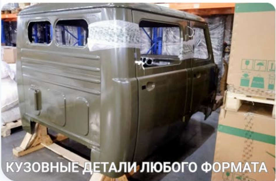
КУЗОВНЫЕ ДЕТАЛИ ЛЮБОГО ФОРМАТА