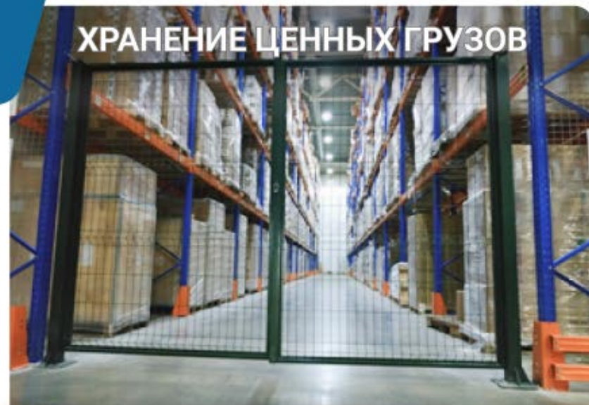
ХРАНЕНИЕ ЦЕННЫХ ГРУЗОВ