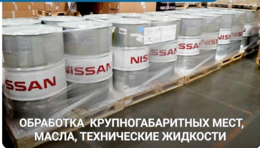
ОБРАБОТКА КРУПНОГАБАРИТНЫХ МЕСТ, МАСЛА, ТЕХНИЧЕСКИЕ ЖИДКОСТИ