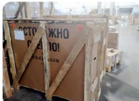
ДЕТАЛИ АВТОМОБИЛЕЙ ЛЮБОЙ СЛОЖНОСТИ