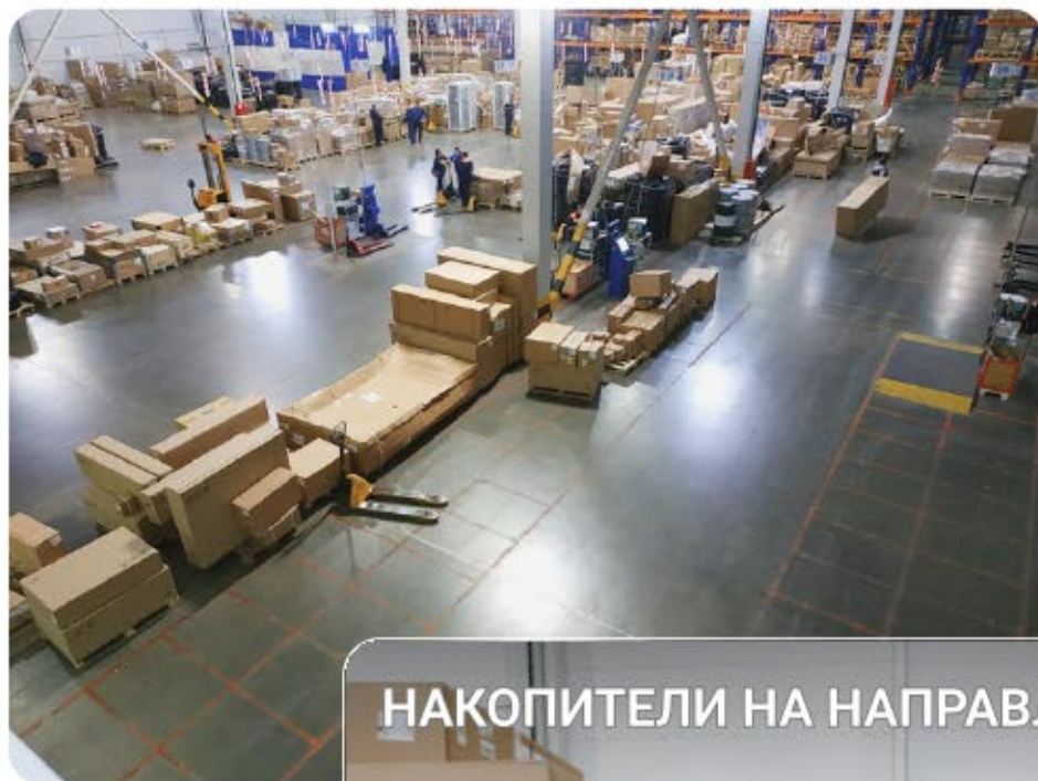
НАКОПИТЕЛИ НА НАПРАВЛЕНИЯ